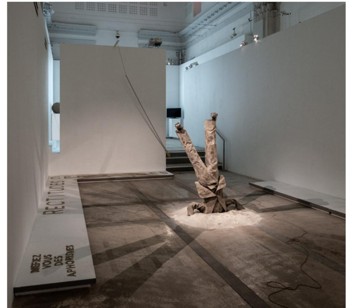
A quoi tu joues ? Ou la politique de l'autruche. 1m55 Résine et cendre (2025)

VUES D'EXPOSITION Entre performance et création permanente en processus pendant toute la période d'exposition. https://fabriceleroux.com/je-suis-lexpo/