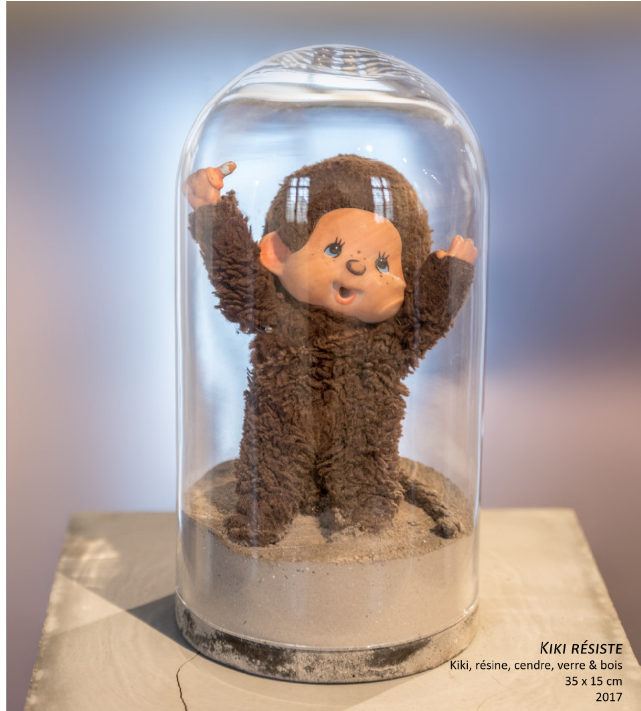
KIKI RÉSISTE Kiki, résine, cendre, verre & bois 35 x 15 cm 2017