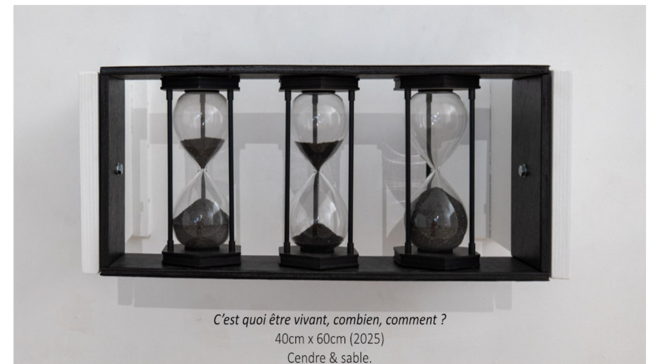
Le temps s'écoule incertain bloquant parfois.