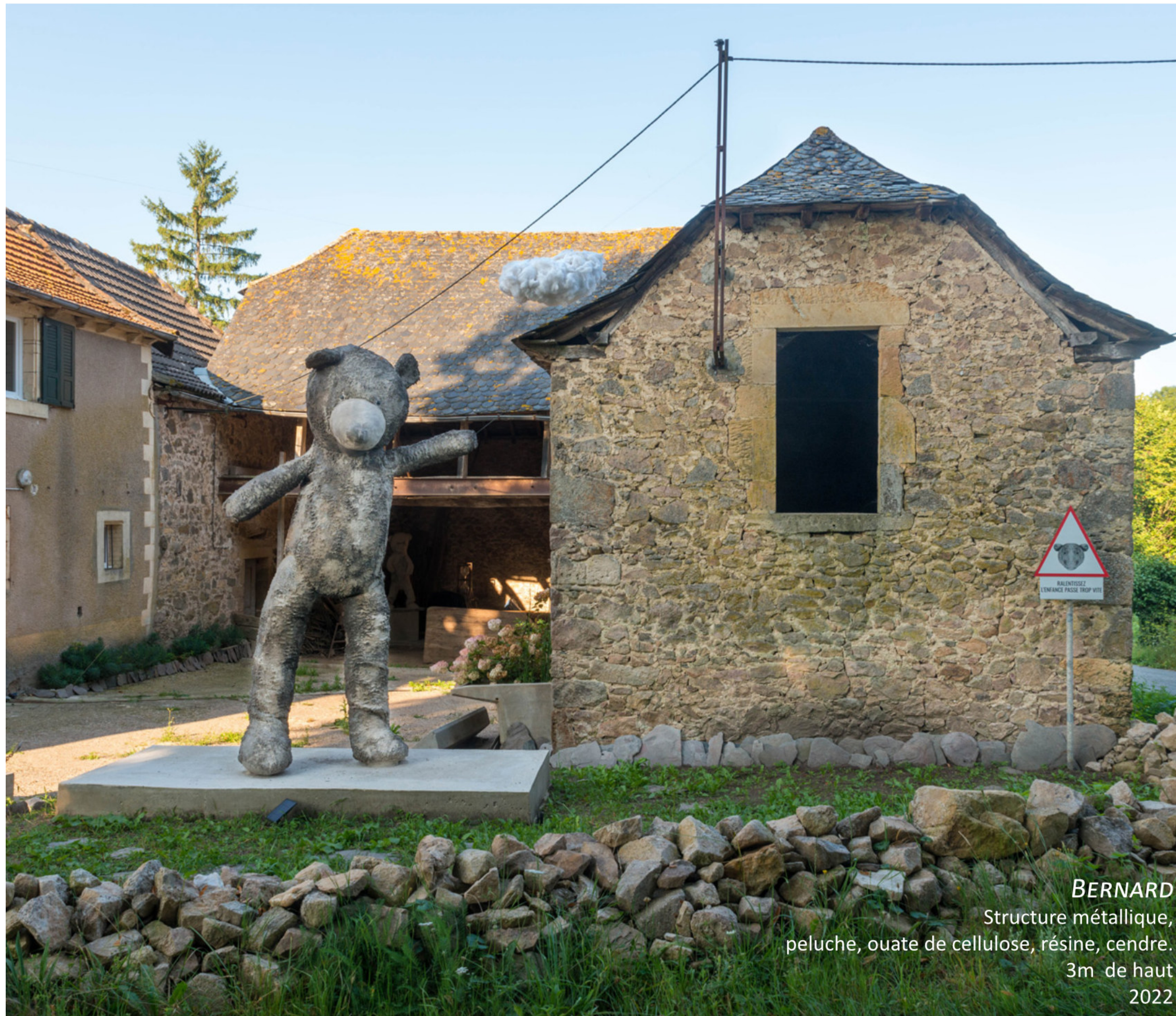
BERNARD Structure métallique, peluche, ouate de cellulose, résine, cendre. 3m de haut 2022