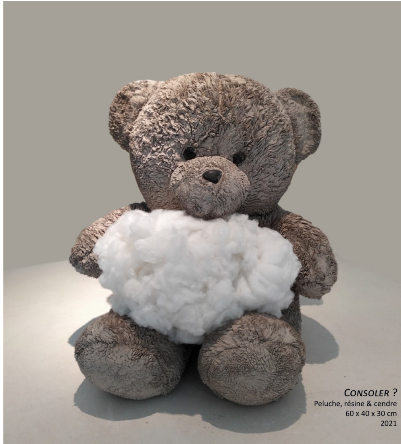
CONSOLER ? Peluche, résine & cendre 60 x 40 x 30 cm 2021