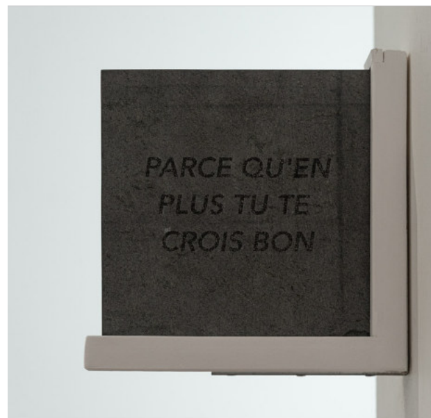
Toute médaille à son revers. Granit 21x 21 cm (2025)